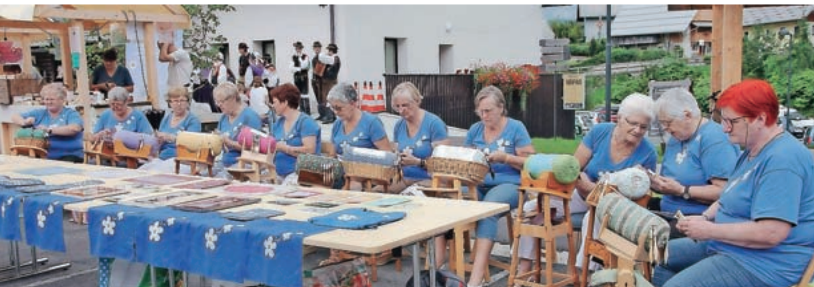
Cvetke v Bohinju na turistični prireditvi Slovenija se predstavi