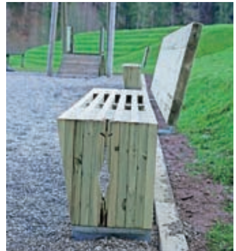
Klop iz odsluženega lesa

prehod v krožno gospodarstvo je poudarila, da krožno gospodarstvo pomeni spremembo našega načina življenja in odnosa do vsega, kar ustvarjamo. "Iščemo rešitve pri snovni in energetski učinkovitosti vsakega posameznega izdelka, da bi bil čim dlje v uporabi in bi ga lahko ponovno uporabili." Prepričana je, da imamo na področju krožnega gospodarstva v Sloveniji veliko znanja in potenciala. Tudi raziskovalec v centru odličnosti InnoRenew Igor Gavrič meni, da ima Slovenija velik potencial za ponovno rabo lesa. "Obenem pa je pri tem veliko izzivov, kako pridobiti ves odsluženi les in kako ga ustrezno procesirati." Ob tem je direktor podjetja M Sora Aleš Dolenc poudaril, da imamo v Sloveniji in Evropi lesa za zdaj še dovolj, obenem pa les velja za obnovljiv, ekološko sprejemljiv naravni material, ki ga v končni fazi lahko uporabimo tudi kot energent, zato manj pogosto razmišljamo o njegovi ponovni uporabi. A podnebne spremembe bodo po njegovih besedah situacijo dramatično spremenile, zato se v njihovem podjetju trudijo ukvarjati s ponovno uporabo lesa. Nakup