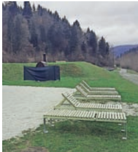
Ležalniki, s katerimi bodo opremili kopališče Pustotnik