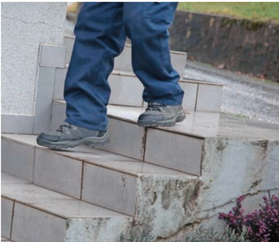
Za preprečevanje padcev lahko največ naredimo sami.

Kaj pa vam pomaga, da se pozimi obvarujete padca? Kaj novega bi še lahko preizkusili? Če želite izmenjati svoje izkušnje na to temo, v Žireh deluje več skupin za preprečevanje padcev, ki jih vodimo prostovoljci. Za konec tako še ugotovitev, do katere pogosto pridemo v skupinah: vsak lahko pade in večina padcev se na koncu dobro razreši, zato naj nas tega ne bo pretirano sram ali strah, obenem pa naredimo vse, kar je v naši moči, da padelec preprečimo.