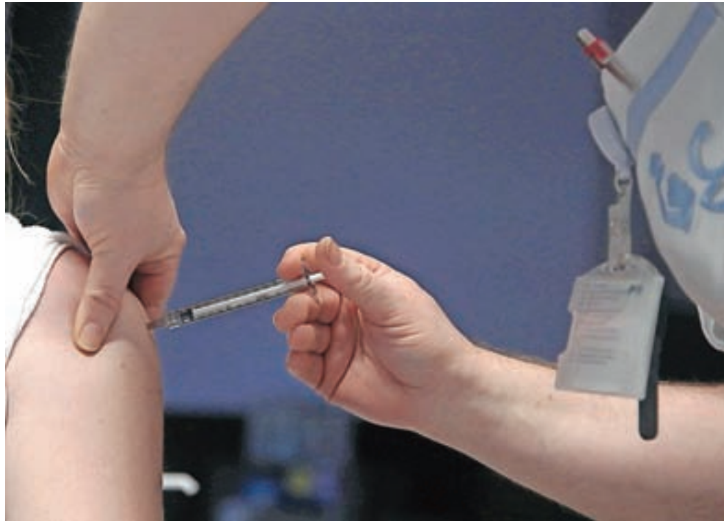
Zanimanje za cepljenje proti covidu-19 je v Žireh veliko.

Občina Žiri je za populacijo vseh treh družinskih ambulant do začetka februarja prejela trideset odmerkov cepiv za osebe, starejše od osemdeset let. V prihodnjih dneh žirovski zdravniki pričakujejo, da se bo že lahko začelo cepljenje starejših od sedemdeset let, seveda pa bodo na cepljenje še vedno vabljeni tudi starejši. Pri doslej cepljenih posebnih stranskih učinkov niso zabeležili. "Stranski učinki so podobni kot pri drugih cepivih, in sicer bolečina na mestu cepljenja, prehodni glavoboli, bolečine v mišicah, porast telesne temperature, mrzlica in utrujenost, ki običajno