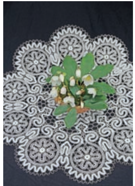
Za Cvetkami je kljub epidemiji razgibano leto.