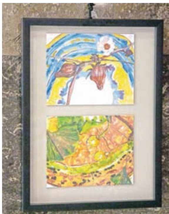
V manjšem formatu