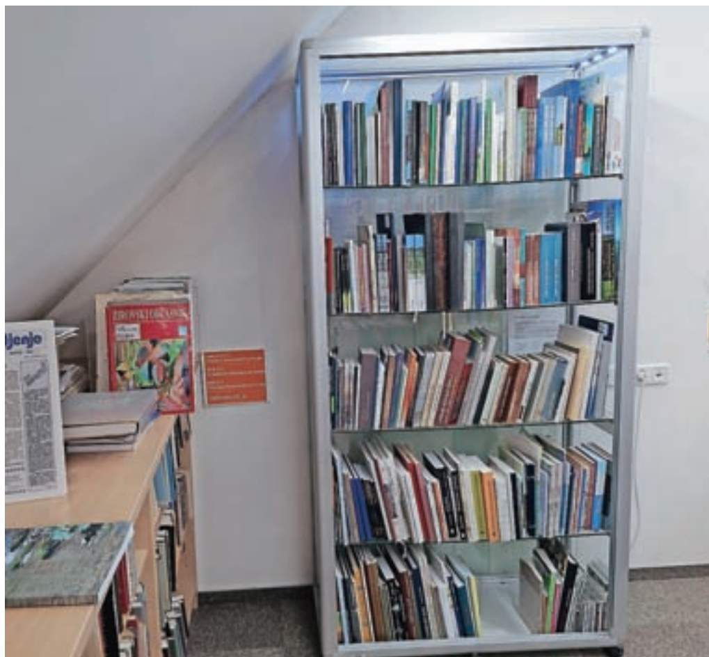
Domoznanski kotiček v Krajevni knjižnici Žiri

Zbirka lokalno ustvarjalnost ohranja iz roda v rod. Nenehno in sistematično se dopolnjuje, razvija in posodablja. Uporabnike informira o aktualnem dogajanju na njihovem območju ter jih seznanja s podobo razvoja domačega kraja. Med različnimi geografskimi in zgodovinskimi knjigami, seminarskimi in diplomskimi deli, raznimi brošurami, serijskimi publikacijami, slikovnim gradivom, videoposnetki in zvočnimi posnetki ter kartografskim gradivom je veliko tudi leposlovnih del avtorjev iz naše občine in bližnje okolice. Posebej