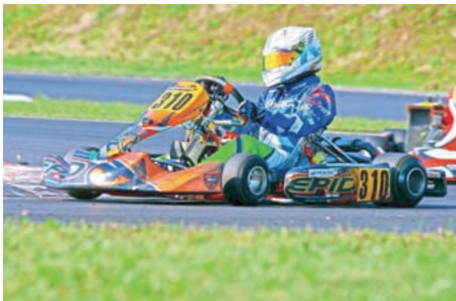
V vozilu

O naslednji sezoni težko govori, saj je trenutna situacija nepredvidljiva. Sama bi rada nadaljevala kariero, hkrati pa se zaveda, da zaradi velikih stroškov morda to ne bo mogoče. Vseeno ostaja nasmejana. In kot sama pravi: "Če bom zdaj morala zaključiti s tem športom, to še ne pomeni, da se kasneje ne morem vrniti."