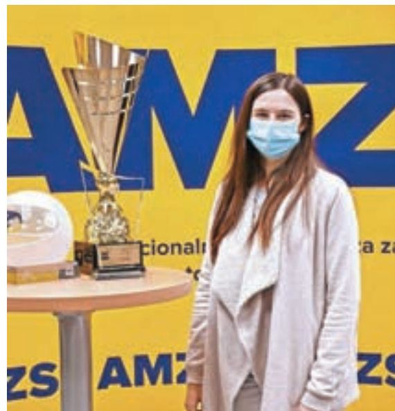
S pokali AMZS

Za vsakim dosežkom in dirko stojijo tudi stroški. Večino stroškov nosi njena družina, to pa pomeni veliko odrekovanja in