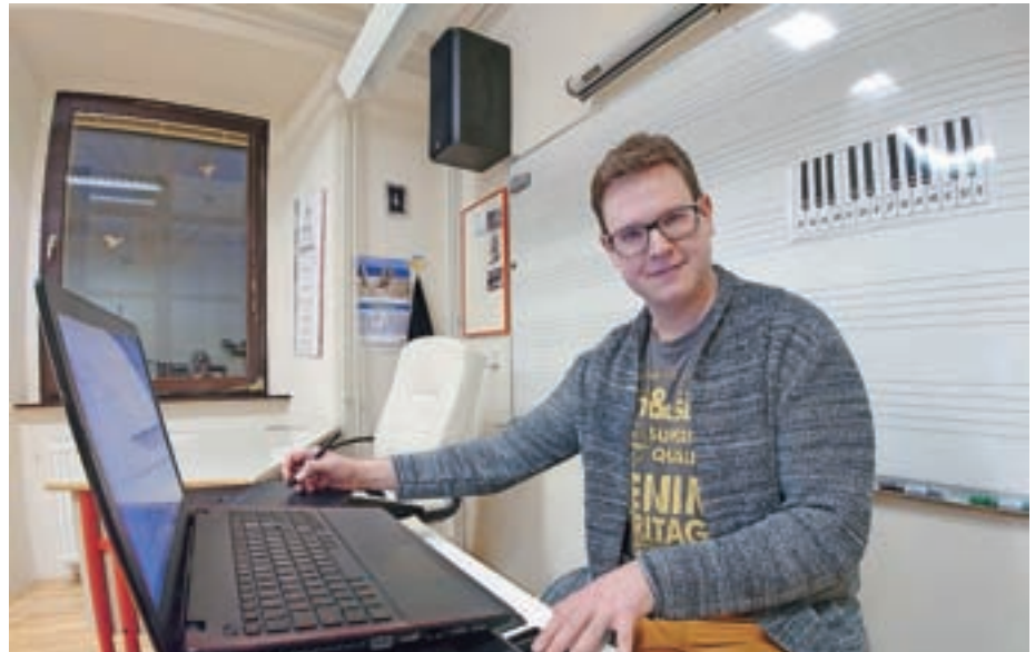
Delo na daljavo je kljub moderni tehnologiji za učitelje velik izziv.

Bolj kot Istran se počutim Primorec – nekako sem gravitiral na kraje v Vipavski dolini, kjer sem preživel tudi srednješolska leta. V meni je nekako vedno tlela ideja o tem, da bi želel ljudem pomagati ali jih voditi skozi izobraževanje, saj sem prepričan, da je merilo napredka samo to, koliko znanja (izkušenj) uspe ena generacija predati drugi. Zdi se mi, da sem se kot učitelj zelo lepo ujel s kolektivom glasbene šole, pa tudi učenci so me hitro in zelo lepo sprejeli. Slednjim se res zahvaljujem za konstruktivno delo, ki ga opravljajo na daljavo, glasbeni šoli pa za podporo v obliki urejenega učnega procesa. Pa tudi