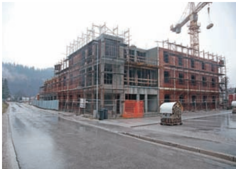
V Žireh hitro napreduje gradnja doma za starejše.