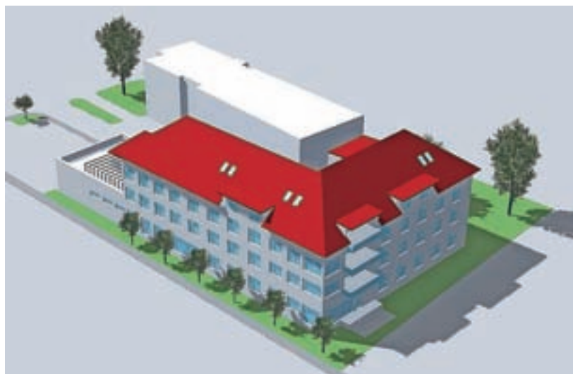
Prve stanovalce bi v domu lahko sprejeli konec letošnjega oziroma v začetku prihodnjega leta.

tako to res dom pete generacije, in ne bolnišnica," poudarja župan. Občina pa je skupaj z Ljudsko univerzo Škofja Loka poskrbela še za organizacijo izobraževanja z možnostjo pre-kvalifikacije za poklic bolničar negovalec, saj bodo te kadre potrebovali tudi v novem domu. "Vsi se namreč strinjamo, da bistvo doma niso lepi prostori, ampak ljudje, ki bodo v njem svoje delo opravljali s srcem," je še dejal župan.