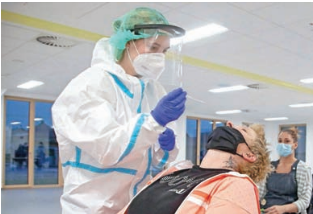
Hitro testiranje na okužbo z novim koronavirusom so omogočili tudi v Žireh.

Da se bo delež okužb v žirovski občini še naprej zmanjševal, pa ostaja odgovornost vseh občanov, saj lahko le skupaj, z upoštevanjem preventivnih ukrepov, cepljenjem ter odgovornim ravnanjem do sebe in drugih virus tudi premagamo.