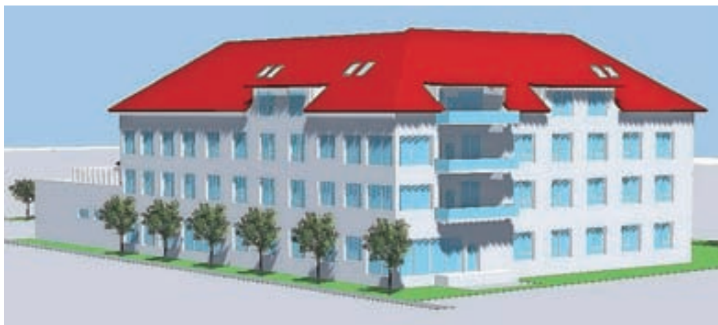
Dom v Žireh

SeneCura je lastnica doma starejših občanov v Vojniku, Mariboru in Radencih ter dializnega centra v Vojniku, ki deluje pod blagovno znamko OptimaMed. V Sloveniji v dogovorih z občinami poleg gradnje doma v občinah Žiri in Hoče - Slivnica načrtujejo še gradnjo nekaterih drugih manjših domov, na primer v Pivki in Komendi.